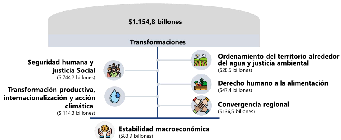
Figura 2. Distribución por transformaciones del PND