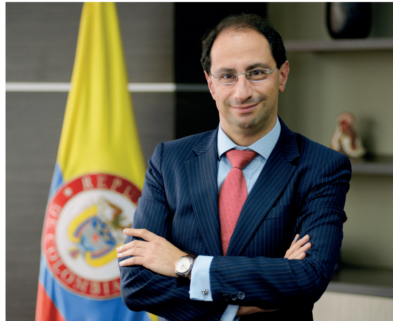
José Manuel Restrepo Abondano. Ministro de Hacienda y Crédito Público

ACIEM: ¿Cómo se clasifica hoy Colombia en materia de reactivación económica frente al resto del mundo?